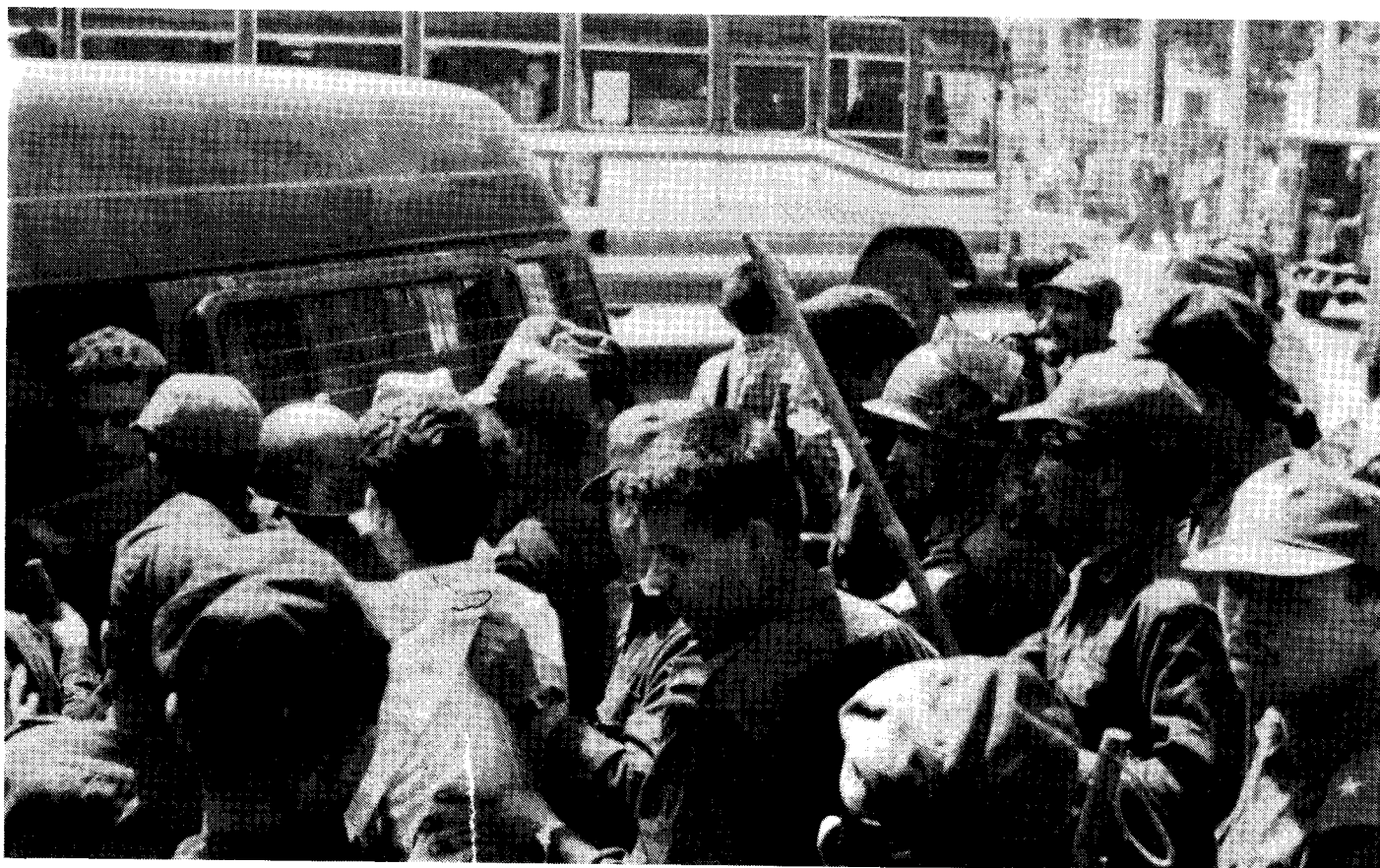
Angebliche Unterstützer der maoistischen Partei werden in Kathmandu verhaftet

Baburam Bhattarai bezeichnet den Volkskrieg als ein epochemachendes Ereignis in der nepalischen Geschichte. Zum ersten Mal sei das nepalische Volk aus seinem Tiefschlaf erwacht und es sei sich der halbkolonialen und halbfeudalen Unterdrückung und Ausbeutung bewußt geworden. Selbst Personen mit geringem politischem Bewußtsein werde zunehmend klarer, daß sich der nepalische Staat derzeit in einer tiefen Krise befinde. Die Ursachen hierfür lägen in der halbkolonialen Eingliederung in Britisch-Indien durch den Vertrag von Sugauli (1816) und in der Fortsetzung dieses Zustands durch den indisch-nepalischen Vertrag von 1950. Die sklavische Ergebnisheit der herrschenden Feudal-