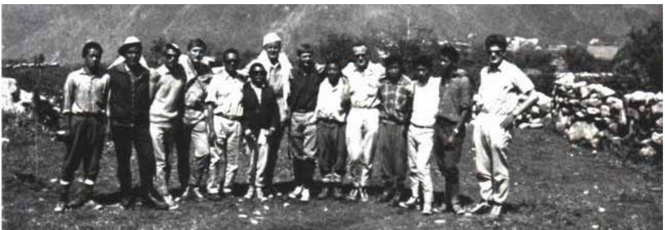
Das Funke-Team 1965