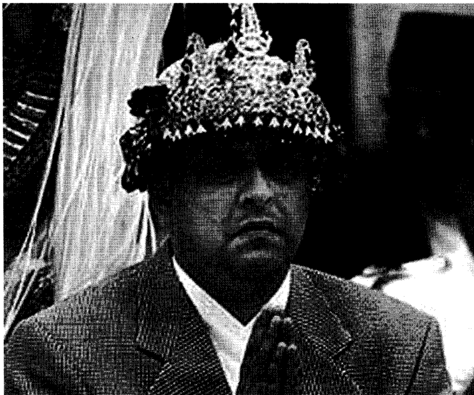
König Gyanendra während der Inthronisation

Auf den ersten Blick wirkt das Vorgehen des Staatsrates schlüssig. Es bleibt allerdings die Frage, ob der Besonderheit der Situation angemessen Rechnung getragen wurde. Das Problem liegt auch hier in der Informationspolitik des Palastes und des Staates. Ähnlich wie bei dem verspäteten Versuch der Aufklärung der Ereignisse bleiben auch hier Widersprüche bestehen. War Dipendra nämlich tatsächlich der Verursacher des Massakers, dann wäre er nach dem Thronfolgegesetz automatisch als möglicher Thronfolger ausgeschieden. Auch hier besteht also weiterer Erklärungsbedarf, wenn das Land wieder zur notwendigen Ruhe zurückfinden soll.