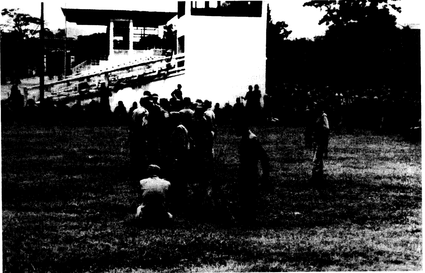
Die Armee untersteht jetzt der Oberaufsicht durch ein National Defence Council

Der Staat soll eine für die Mobilisierung der natürlichen Ressourcen und Vermögenswerte des Landes geeignete Politik verfolgen, welche geeignet, brauchbar und nützlich im Interesse des Landes ist (Abs. 3). Der Staat soll dem Schutz der Umwelt des Landes Vorrang einräumen und auch weitere Schäden aufgrund physikalischer Entwicklungsaktivitäten vermeiden, indem in der allgemeinen Öffentlichkeit das Bewußtsein für eine saubere Umwelt verbessert wird. Der Staat soll auch