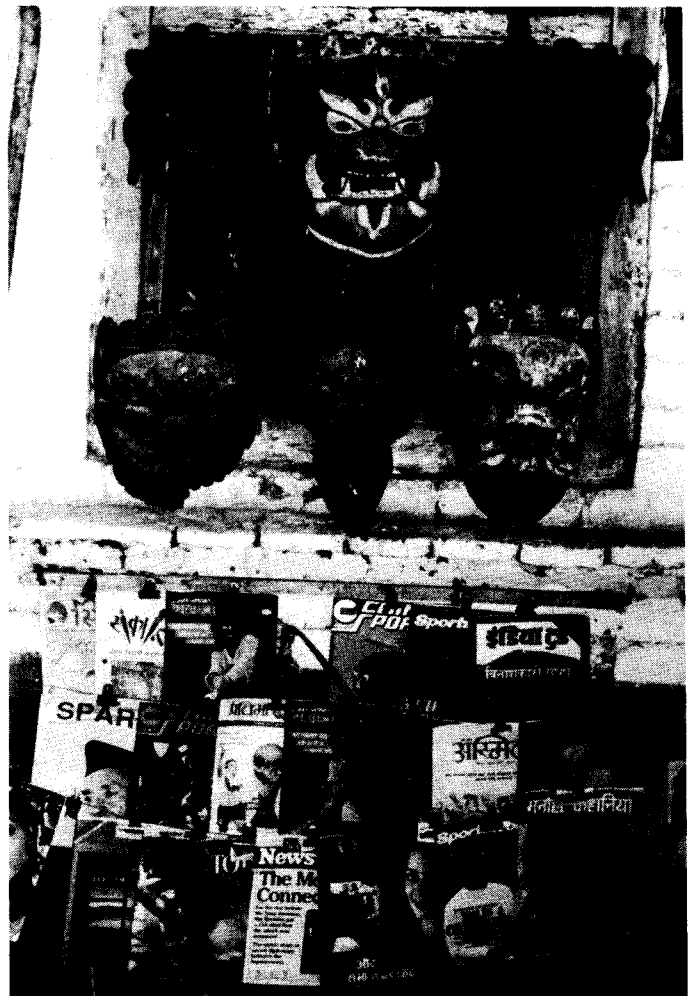
Die neue nepalische Verfassung garantiert Pressefreiheit

Schließlich verbietet Artikel 21 Menschenhandel, Sklaverei, Leibeigenschaft und Zwangsarbeit in jeglicher